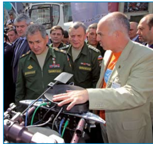
День инноваций Министерства обороны РФ. Август 2013 года. Глава Минобороны заинтересовался легкомоторными учебными самолётами МАИ-223 «Китенок» и ударным беспилотным вертолётom «Ворон-333».

Недавний опрос 173 профильных предприятий показал, что среди руководителей этих предприятий 177 выпускников МАИ, из них: