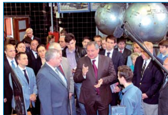
Вице-премьер правительства России Дмитрий Rogozin знакомится с новейшими научными разработками маёвских ученых и студентов. Май 2013 года.

В настоящее время в университете по различным формам обучения на 12 факультетах, в 2 институтах (на правах факультетов) и 4 филиалах обучается около 20 000 человек. 93 % студентов вуза учатся по приоритетным направлениям развития МАИ как национального исследовательского университета. В 2015 году набор абитуриентов по федеральным государствен-