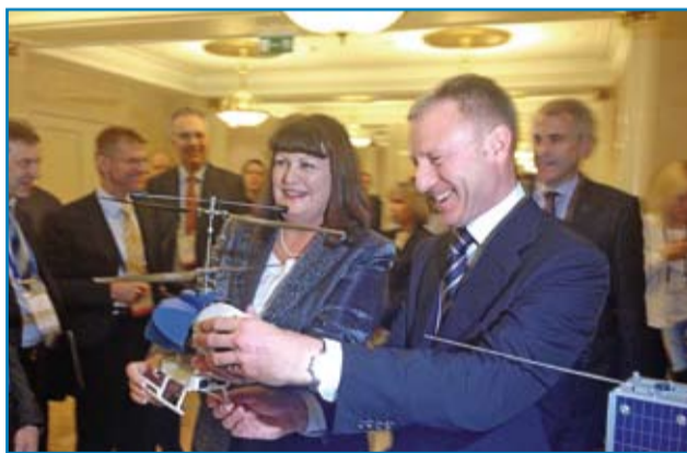
Разработки МАИ вызвали живой интерес со стороны главы Министерства образования и науки России Дмитрия Ливанова и еврокомиссара по исследованиям, инновациям и науке Мойры Гейган Куинн, которые посетили экспозицию вуза во время торжественного открытия Года науки Россия – ЕС

Московский авиационный институт представляет собой аналог технопарка, в котором, наряду с учебными аудиториями, сконцентрированы многочисленные научные лаборатории,