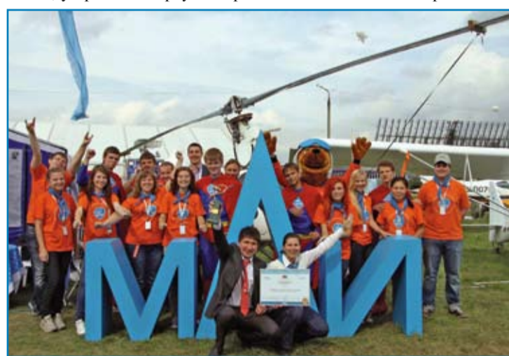
Настроение — отличное. Маёвцы победили в конкурсе «ЗОЛОТЫЕ КРЫЛЬЯ МАКС 2013», в номинации «Мероприятие». Август 2013.

Созданный в 2011 году Сколковский институт науки и технологий возглавил Почётный доктор МАИ Э. Кроули. В работе Сколтеха также