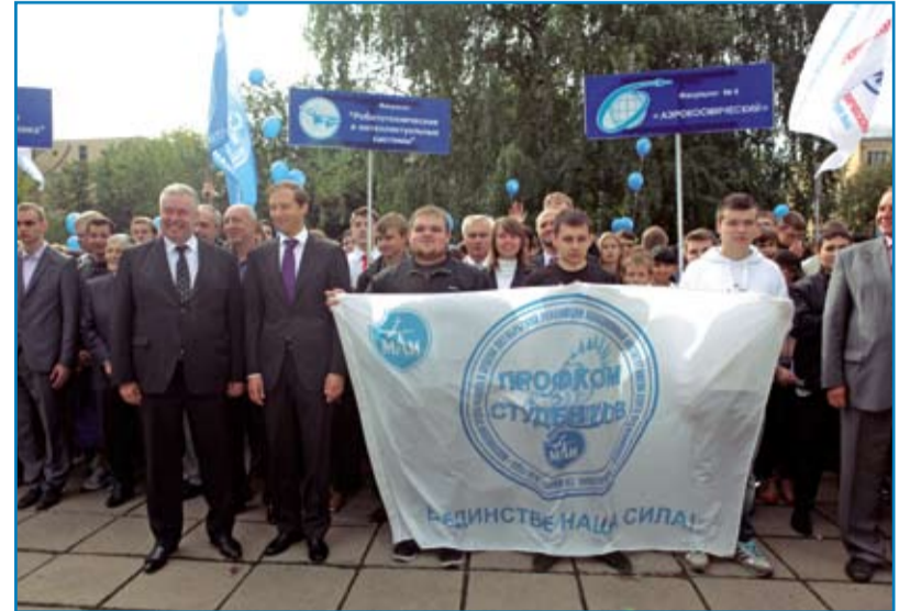
Министр промышленности и торговли РФ Денис Мантуров со студентами и ректором МАИ 2 сентября 2013 года.

боратория высокочастотных ионных двигателей МАИ (Лаборатория ВЧ ИД МАИ) под руководством профессора Хорста Вольфганга Лёба (Германия) — учёного с мировым именем, специалиста в области ВЧ плазодинамики и электроракетных