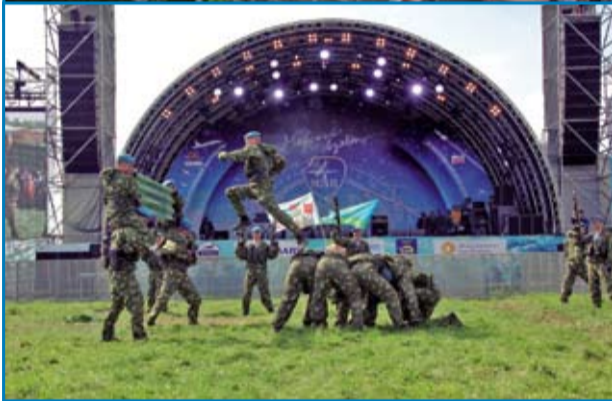
«Майский взлёт» -2014. Гости фестиваля – воины-десантники 38-ого отдельного полка связи Воздушно-десантных войск России.

ми университетами. Московский авиационный институт принимает активное участие в международных ассоциациях. Среди них: Всемирная инициатива инженерного образования (CDIO); Европейская ассоциация аэрокосмических университетов PEGASUS, Ассоциация технических университетов России и Китая и другие.