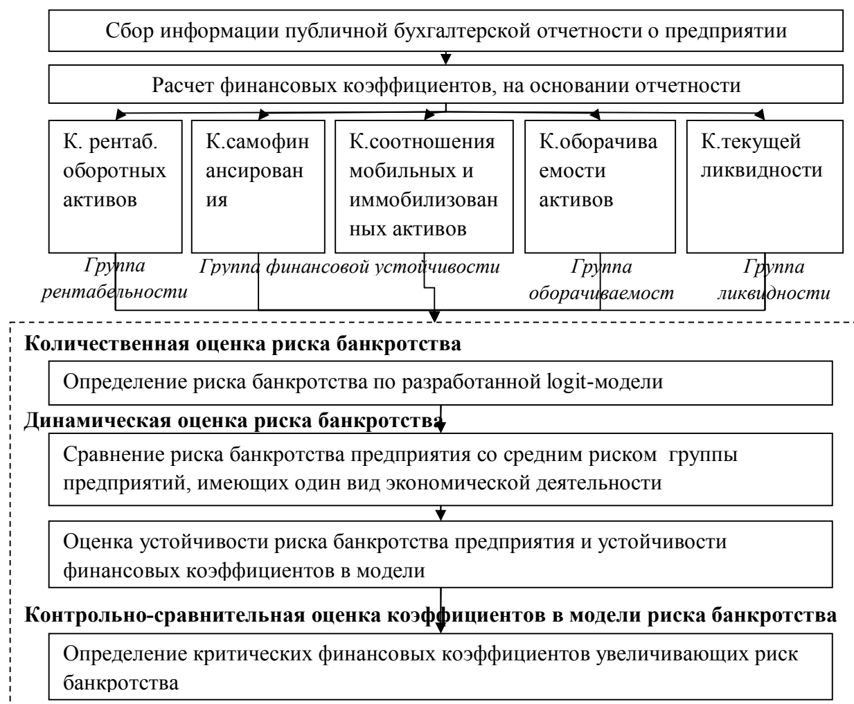
Рис.1. Система диагностики риска банкротства предприятий авиационно-промышленного комплекса

На основе полученных двух массивов данных (банкрот - небанкрот), разрабатывается logit-модель оценки риска банкротства, вычисляющая вероятность банкротства предприятия, которое принимает значение от 0 до 1 (от 0% до 100%). Вывод о вероятности банкротства делается в зависимости от «близости» расчетного значения вероятности к 0 или к 1. Ноль означает минимальный риск банкротства, единица – соответственно максимальный.