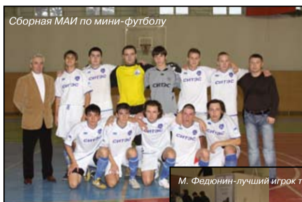
Сборная МАИ по мини-футболу

Статья подготовлена дирекцией информации СК МАИ