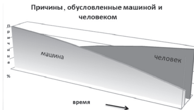
Рис. 1. Развитие роли человеческого фактора в авиатранспортной системе

Одной из важнейших характеристик человека является время его реакции. В общем виде время реакции — это время, которое проходит от начала появления раздражителя до окончания двигатель-