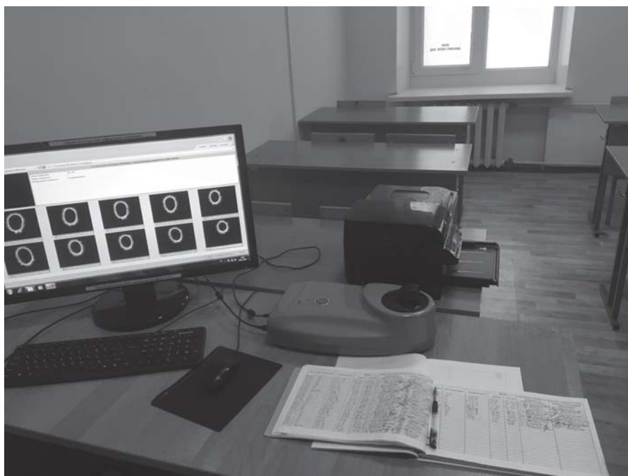
Рис. 1. ГРВ-камера